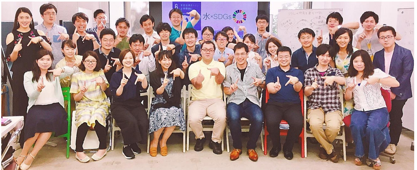
「水×SDGs」勉強会の参加者

Japan-YWPは、水に関する多様な専門を持った若手の集まりですし、また「水×SDGs」には水を直接の専門とはしない方々にもご参加いただいています。そのため、専門的知見と多様な意見を集約する場を「水×SDGs」は提供しています。そして、話し合いが前向きになるように、自由な発想を大事にすると同時に他人の意見を尊重すること、自分事として考えるようにすること、チャタムハウス・ルール（外部で議論の内容を引用しない）を参加のルールにしています。